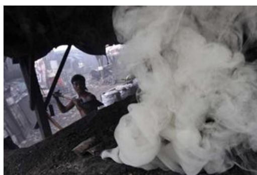
Un trabajador rodeado de sustancias contaminantes.

Contaminantes y sustancias tóxicas resultantes de actividades industriales amenazan la salud de 125 millones de personas en el mundo, especialmente en los países en vías de desarrollo, donde 80 millones están en riesgo de morir prematuramente o perder calidad de vida por causa de este contacto.