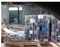
Haina (Repubblica Dominicana). L'ambiente è saturo di piombo

Tre sono in Russia, ma Chernobyl è solo nona. Luoghi in cui l'aspettativa di vita è simile a quella del medioevo in Europa