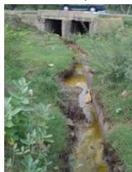
Ranipet, in India: altissimo inquinamento da cromo esavalente